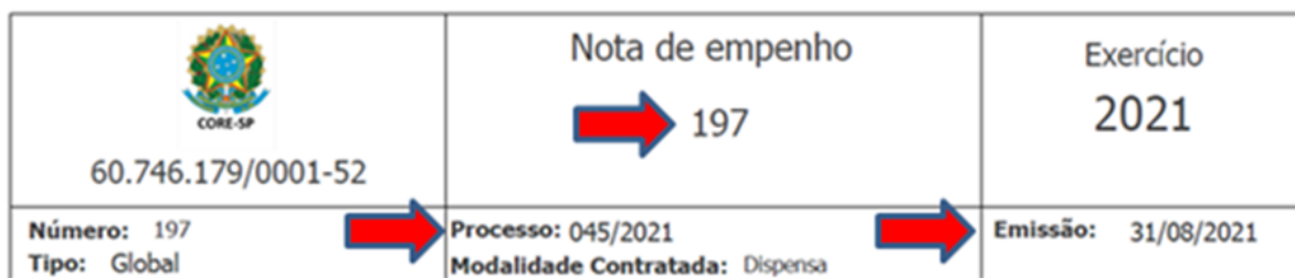
Figura 1: Exemplo de cabeçalho da Nota de empenho com as informações para a contratada informar na nota fiscal.

8.28. Na efetivação do pagamento será efetuada a retenção na fonte dos tributos e contribuições, de acordo com a IN nº 1234, de 11 de janeiro de 2012, da Secretaria da Receita Federal do Brasil e suas alterações.